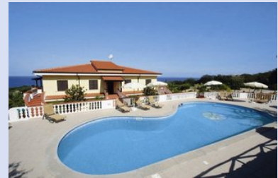
5i EYbUi ZbUa Y